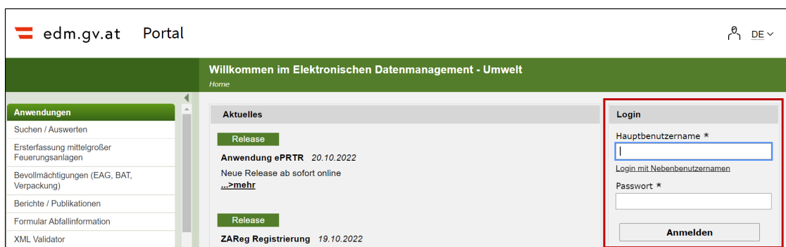
Abbildung 1 Login-Bereich am EDM-Portal

Information für Registrierte: Der Hauptbenutzername liegt im Format „edm12345“ vor. Die Zugangsdaten werden nach abgeschlossener Registrierung in zwei Einzelbriefen verschickt. Bei Angabe der Mail-Adresse wird die Registrierungsbestätigung an diese versendet, ansonsten so wie der Passwort-Brief per dualer Zustellung an das elektronische Postfach im Unternehmensserviceportal oder die angegebene Postanschrift.