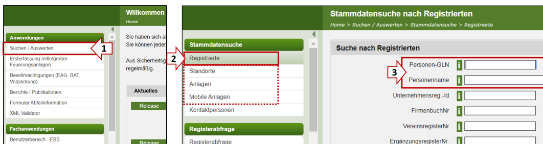
Abbildung 3 Einstieg für Behördenbenutzer:innen über „Suchen/Auswerten“ in die Stammdatenverwaltung ZAReg und Suche nach dem Registrierten

Den Registrierten über die Anwendung „Suchen/Auswerten“ (1) mit der „Personen-GLN“ oder dem „Personennamen“ suchen (2-3). Es kann auch nach dem Standort oder der Anlage gesucht werden (2).